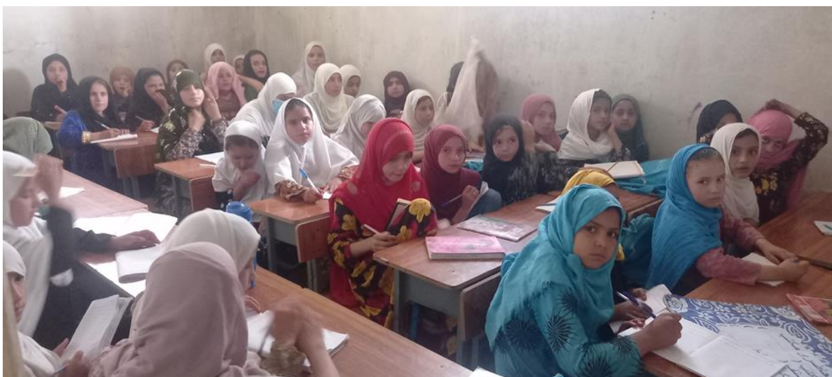
تصویر - 3: شاگردان مکتب ابتدایی دختران شهرک تعمیر در چوکیهای اهدایی "انجمن" نشسته و درس می خوانند.

بدینوسیله، به تعداد 25 سیت میز و چوکی سه نفری ساخت وطن را به قیمت مجموعی مبلغ 50000 افغانی از مدرک پرداخت های داوطلبانه هموطنان عزیز ما در "انجمن" تهیه و به اداره مکتب تسلیم نمودیم. بلا فاصله و در همان روز، دخترکان متعلم، روی میزها و چوکی های اهدایی "انجمن" صنف درسی خود را آغاز و ادامه داند (تصاویر 3 و 4).