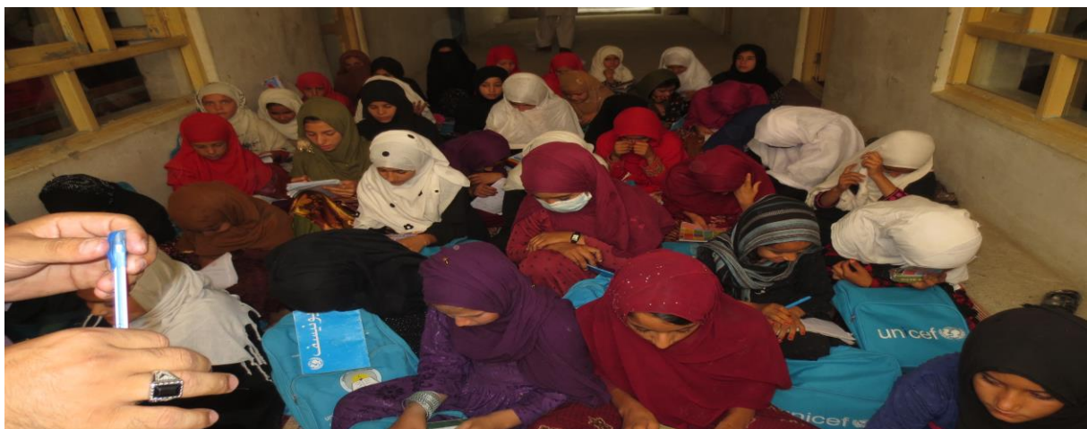
تصویر - 2: یک صنف مکمل شاگردان مکتب شهرک تعمیر، بدون میز و چوکی و روی فرشهای کهنه برگزار شده است.

سال گذشته هیأت "انجمن"، در جریان سروی این مکتب با بزرگان و اولیای شاگردان جلسه مشترک را در منزل سرمعلم مکتب برگزار نموده و ضمن کار ترویجی فرهنگی در زمینه کمک به مکتب و حمایت از آن و اعزام دختران خود به مکتب، توجه آنها را معطوف نمودند. گرچه کمافی السابق مکتب در تهکوی فعالیت دارد، ولی حالا سه اتاق آن مکمل با هفتاد و پنج سیت میز و چوکی سه نفری اهدایی "انجمن" مجهز بوده و هیچ یک از میز و چوکیها صدمه ندیده است. هر سه صنف پر از صفوف فشرده دخترکان متعلم در این مکتب بود. صرف یک صنف آنها نسبت نبود اتاق درسی، در دهلیز و روی فرش دایر گردیده بود (تصاویر 1 و 2).